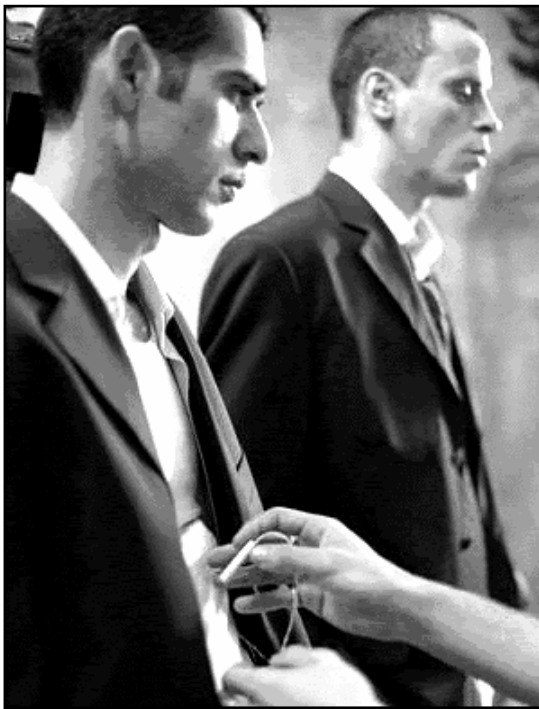
Verkabelung des Bombengürtels. Szene aus dem Film.

Stille beim Filmabspann, kein Geräusch, kein Gespräch, keine Musik. Das Publikum zelebriert die anempfohlene Einfühlung. Gerade noch hat sich auf der Leinwand der Palästinenser Said in einem Bus voller israelischer Soldaten in die Luft gesprengt. Die Besucher des Berlinale-Favoriten »Paradise Now« trauern um den Mörder als tragisches und darum eigentliches Opfer, dessen Beweggründe sie nicht teilen müssen, um sie doch zu verstehen.